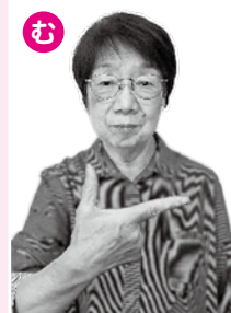
数詞「6」と同じ表現です