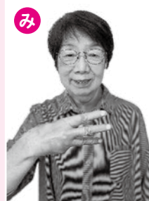
カタカナの「ミ」の形から