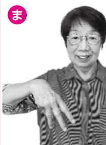
アルファベットの「m」から