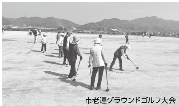
市老連グラウンドゴルフ大会

高齢者が人口の4人に1人を占め、人生100年時代を迎えた今日、老人クラブ活動に対する社会的な期待は、ますます大きくなっています。浅口市老人クラブ連合会は、今後も身近な仲間との協力のもと、会員が自らの役割を実感できる機会を増やし、地域にとって欠かせない存在として、より元気で魅力あるクラブづくりに尽力してまいります。