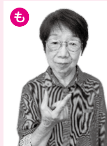
人差し指と親指を閉じます。動きのある指文字です