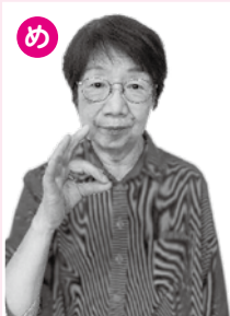
「目」を表すジェスチャーに似ています