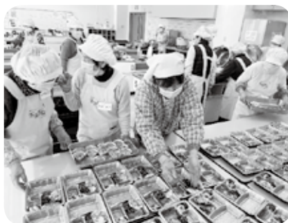
一人暮らし高齢者へのお弁当づくり