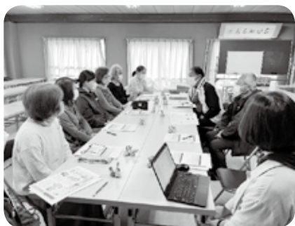
地区の福祉を考える座談会