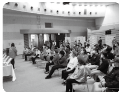
ボランティアフェスタ（ボランティア連協）