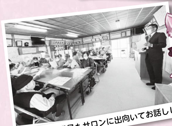
社協職員もサロンに出向いてお話しします