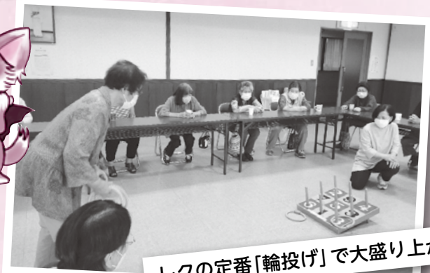
レクの定番「輪投げ」で大盛り上がり!