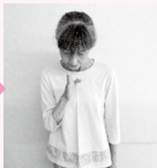
頭を下げ、顔前で斜めに構えた右手を少し前へ出す