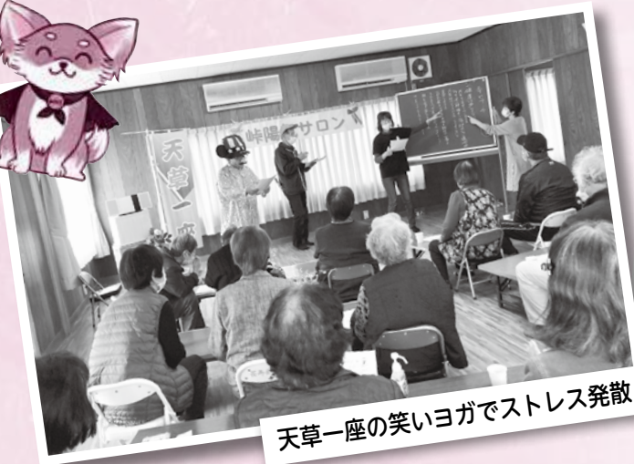
天草一座の笑いヨガでストレス発散!