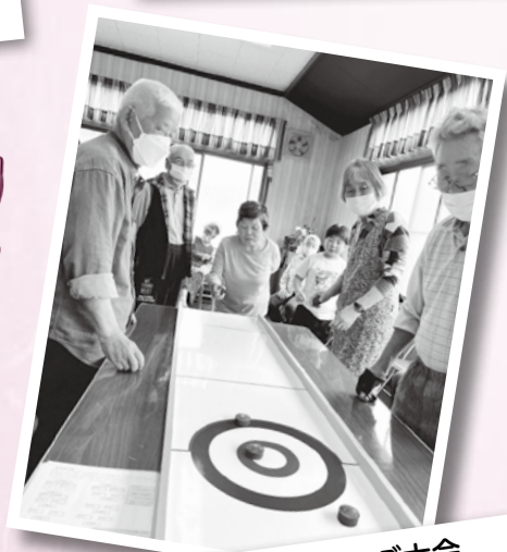
三世代カーリング大会