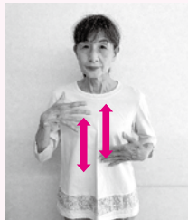
湾曲した両手の指先を胸に向け、交互に、上下に動かす