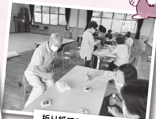
折り紙でコマづくりに挑戦!